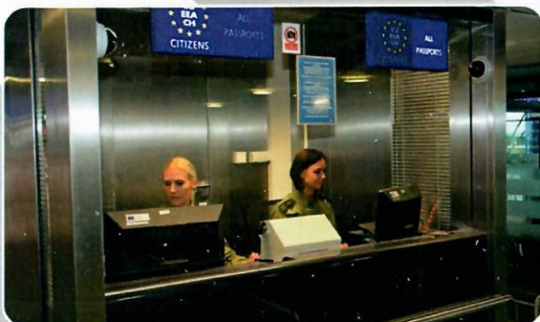
Funkcjonariuszki podczas odprawy granicznej na lotnisku w Gdańsku.