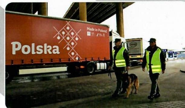
Funkcjonariusze patrolują terminal promowy w Gdyni z wykorzystaniem psa służbowego.