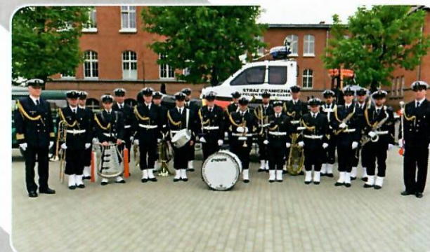
Orkiestra Morskiego Oddziału Straży Granicznej.