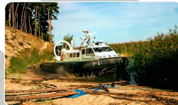
Poduszkowiec SG-411 typu GRIFFON 2000 TD MK III.