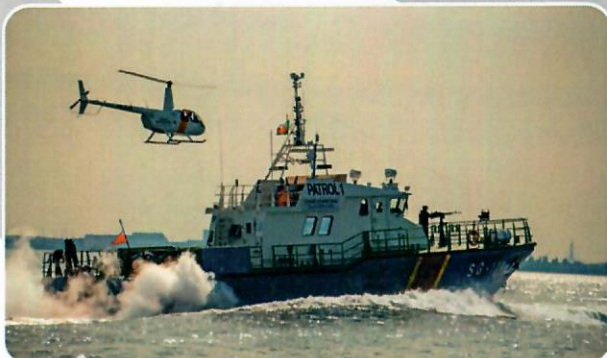
Jednostka pływająca SG-111 typu Patrol 240 Baltic.